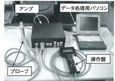
▲磁歪法による応力測定装置

これまでに、全応力が測定できる点を活用し橋桁の死荷重応力推定 (1) や拘束応力評価への適用を行っております。また、鋼材自体をセンサにできることを利用して配線レスの高耐久性の鋼製荷重センサを開発し、グラウンドアンカー張力計測へ適用中です。